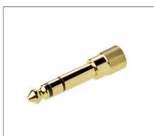
変換用φ6.3mmステレオ標準プラグ