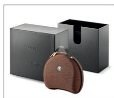
高剛性ヘッドフォンキャリングケース等を同梱したパッケージ