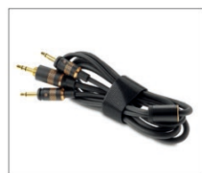
φ3.5mmステレオミニプラグ付き着脱式ケーブル(1.2m)