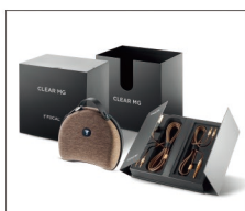
高剛性キャリングケース等を同梱したパッケージ