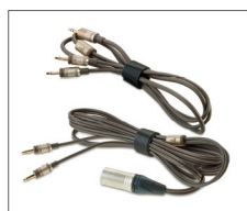
φ3.5mmステレオミニプラグ付き着脱式ケーブル(1.2m) XLR(4ピン)プラグ付き着脱式ケーブル(3.0m)