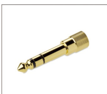
変換用φ6.3mmステレオ標準プラグ