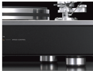
アンダースラング構造

PD-151は主要なパーツすべてを、メインシャーシとなる10mm厚のアルミ製トッププレートに取り付ける、ラックスマン独自のアンダースラング(吊り下げ)方式を採用しました。これにより高い剛性と防振性の両立に成功しました。