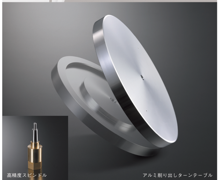
高精度スピンドル