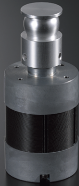
ブラシレスDCモーター

重量級のプлатターを力強く、正確に安定して回転させるベルトドライブアナログプレーヤー。モーター部は、その構成要素の根幹を成す最も重要なパーツの一つです。PD-151では、高信頼性の低速モーターをベースに、サイン波PWM、PID制御の回転数制御プログラム、低騒音の音響用ベアリングの採用、コイルの巻数の変更など、数々の改良を積み重ね、約2年の開発期間をかけて、オリジナルの高精度高トルクブラシレスDCモーターを完成しました。これにより、33 \frac{1}{3} 、45回転に加え、78回転の対応も可能としました。(PID制御:「Proportional: 比例演算」目標回転数への素早い制御、「Integral: 積分演算」微小誤差を吸収する制御、「Differential: 微分演算」急速な変動に対する制御、これら3つの異なる反応の制御を高度に融合し、常に正確な回転を実現。)