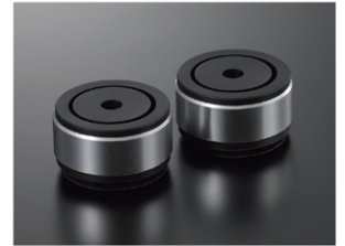
特殊制振ゴム採用のインシュレーター

重量のあるターンテーブルが絶え間なく回転し続けるアナログプレーヤーにとって、コンポーネントを支えるインシュレーターは非常に重要なパーツです。温度特性や経年変化に優れた特殊な制振ゴムを新設計のインシュレーターに組み込みました。また8mmまでの高さ調節も可能です。