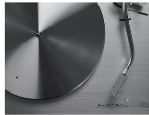
ヘアライン仕上げのトップパネル

10mm厚アルミにヘアライン仕上げを施したトップパネル上に、トーンアーム、モーター、ターンテーブルのアナログプレーヤーを構成する3大要素のみを配したデザインはシンプルさと機能美を追求。マットブラック塗装を施した筐体との絶妙なコントラストが重厚感を演出します。