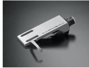
マグネシウム製ヘッドシェル

ヘッドシェルは軽量で強度に優れたラックスマンロゴ入りのマグネシウム合金製を付属しました。カートリッジ出力用のフォノケーブルには、オーディオグレードのOFC線材を採用し、プラグに最もスタンダードなDIN→RCA端子タイプのフォノケーブルを用意しました。