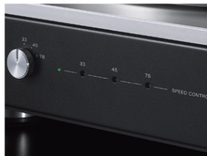
回転数微調整ボリューム

PD-151では、33 \frac{1}{3} 、45、78各回転数をフロントパネルの回転数微調整ボリュームで調整することができます。確認用の回転数偏差インジケータは正常時緑点灯、指示回転数から遅れた際は緑点滅、速まった際は青点滅と、緑・青の2色表示により、細かな調節を可能にしています。