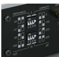
背面の負荷調整スイッチ

使用するカートリッジの特性に合わせる負荷インピーダンス切り替え(34/47/56/100kΩ)と、負荷容量切り替え(0/100/220/320pF)スイッチを背面に装備し、カートリッジが持つポテンシャルを引き出します。