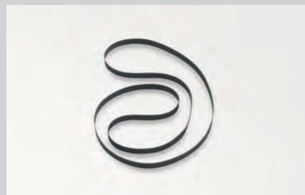
交換用ゴムベルト