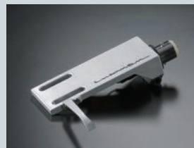
マグネシウム製軽量ヘッドシエル

付属のヘッドシエルは軽量で強度に優れたマグネシウム合金製。そしてレコードを演奏する手もとを照らす、着脱可能な高輝度LEDタイプのスタイラス・ライトを装備し、灯りを落としたリスニングルームでも快適に音楽をお楽しみいただけます。OFC線材採用のフォノケーブルには一般的なDIN→RCA端子タイプを付属。4mm厚のアクリル材によるダストカバーは、カムサポート式ヒンジ機構によって軽くスムーズな開閉操作を実現しました。また、着脱可能な電源ケーブルには、音質に定評のあるJPA-10000が付属します。