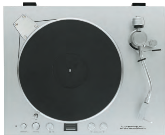
製品にはダストカバーが付属しています。