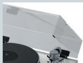
アクリル製ダストカバー