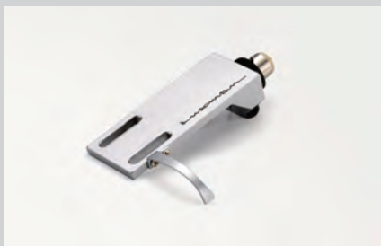
マグネシウム製軽量ヘッドシェル OPPD-SH1 JANコード：495813603594-5 重量13g (ワイヤーを含む)