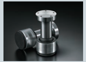
シャーシ直結のインシュレーター

主要なパーツすべてを、独自のアンダースラング（吊り下げ）方式でメインシャーシとなる15mm厚のアルミプレートに取り付け、高剛性と制振性の両立に成功。振動源となるモーターと電源トランスはフローティングマウントとしてさらなる高S/N化を図りました。ハウリングと外部振動の伝達を防止する大口径インシュレーターもこのメインシャーシに直結。加えて、外装材を兼ねた木材と金属シャーシのハイブリッド制振構造が、高音質に寄与しています。