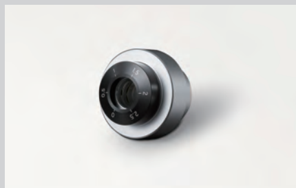
ヘビーウェイト OPPD-HW1 JANコード：495813603593-8 適合カートリッジ自重 9~19g (ヘッドシェル込み22~32g)