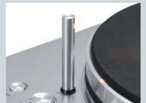
着脱式スタイラス・ライト