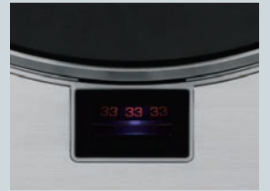
反射式ストロボスコープ

LED照射の反射式ストロボスコープによって、33 \frac{1}{3} 回転と45回転を独立して精密に微調整できます。窓に映るストロボパターンには、一般的なドットや模様ではなく、回転スピード数そのものを表示。操作する楽しみを演出します。