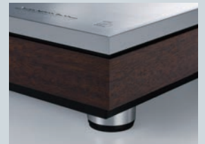
金属と木材のハイブリッドデザイン

操作のたびに人の手が触れるアナログプレーヤーにとって、外装材の選択や仕上げは大変に重要です。PD-171はこれらに伝統的な金属と木材の組合せを採用。上質なヘアライン仕上げのアルミプレートと質感あふれるウッドパネルが落ち着いた雰囲気をもたらします。