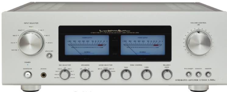
L-505u JANコード: 495813600038-7

最も身近な高級機として多くの音楽ファンを魅了し続けてきたL-505シリーズに待望のアルティメット・エディションが誕生しました。最新バージョンのODNF回路を搭載、さまざまなリスニング環境にも対応する機能性をまとめて大きく進化したL-505u。暖かみと浸透力のあるラックスマン・サウンドが、あなたの音楽生活に新しいページを開いてくれるでしょう。