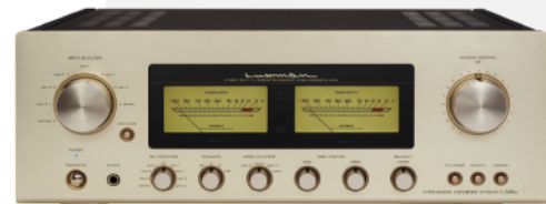
L-505u(g) (限定色) JANコード: 495813600039-4