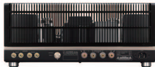
※出荷時にはボンネットが装着されています。