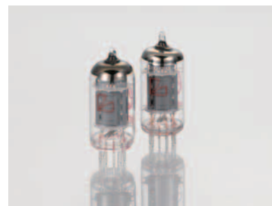
JJ製の高信頼管ECC803S / 802S

※CL-38uL、MQ-88uLともに、90台の限定生産となります。※本製品の詳しい特徴・仕様・スペックについては、ベースモデルCL-38u、MQ-88uの製品カタログをご覧ください。